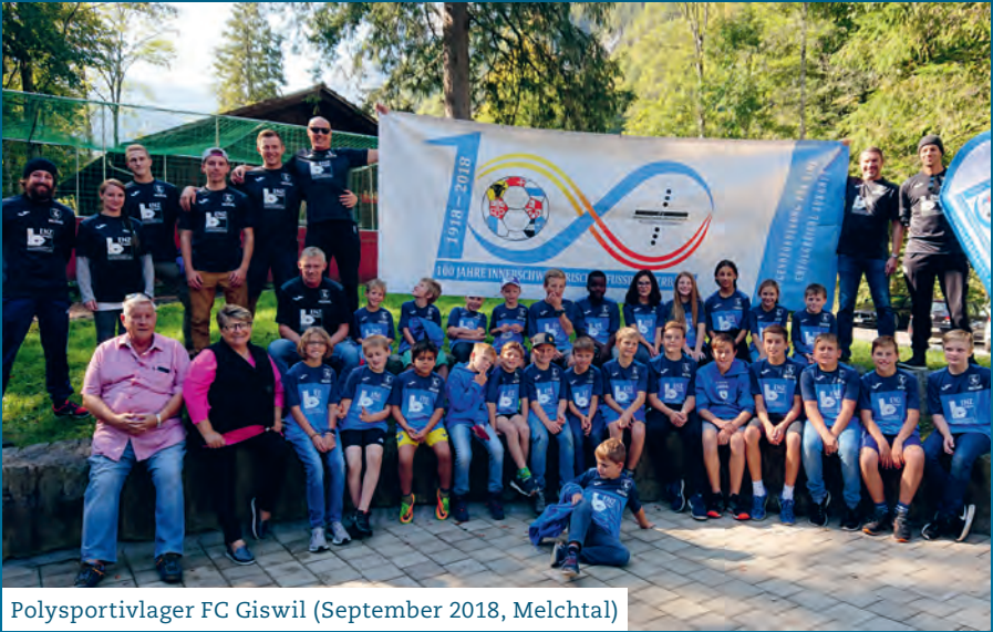
Polysportivlager FC Giswil (September 2018, Melchtal)