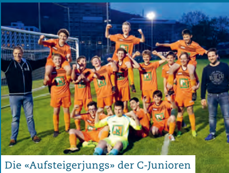
Die «Aufsteigerjungs» der C-Junioren